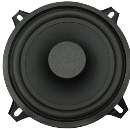
AS 130 FL EVO