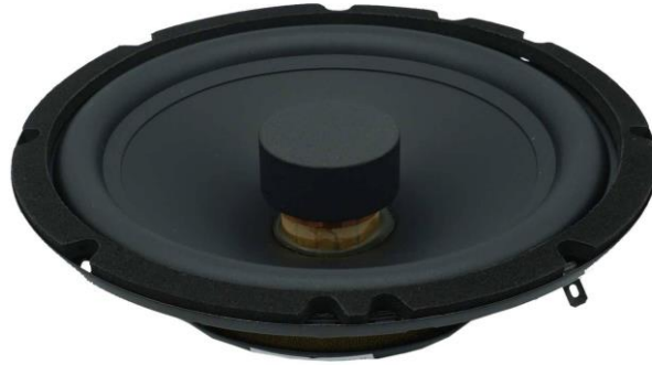
AS 165 FL EVO