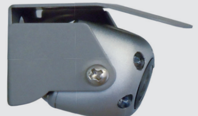
Rear view camera with four IR LED's for use with campers, caravans and motorhomes