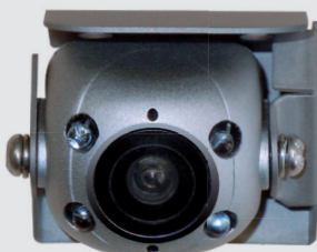
Rückfahrkamera mit vier IR LED's für Camper und Caravan bzw. Motorhome Fahrzeuge